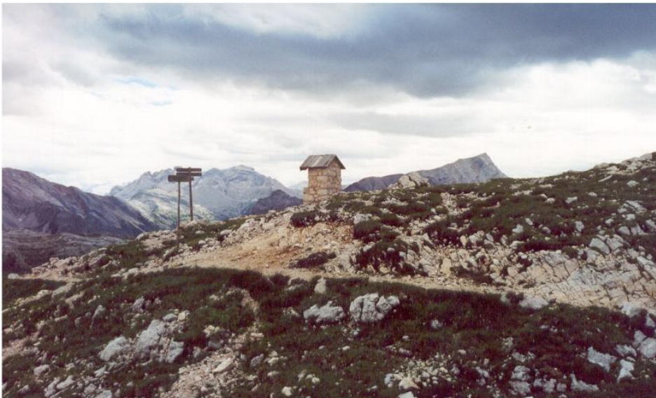
Foto 18 - La Forcella Sora Forno, punto più alto del Tour

L'inizio della seconda tappa è incantevole ed il risveglio al rif. Biella (2327 m) offre un panorama stupendo. Presi i nostri mezzi ci dirigiamo, in un tratto di salita a