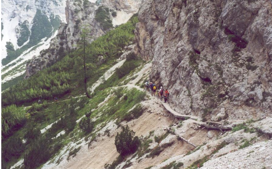
Foto 21 - Un passaggio da brivido

risalendo sempre con il nostro segnavia "1"; un secondo salto roccioso per arrivare ad una larga conca che porta al bellissimo Lago di Braies. Il sentiero, dopo alcuni tonnati e passato un ponticello in legno attrezzato con catena (vedi foto n° 21) in un